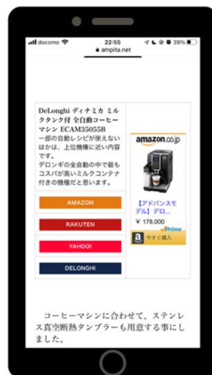
作成したリンク(スマホ画面)

画像またはアフィリエイトリンク用の iframe を取得して URL 欄に入力します。タイトルや説明文を任意で入力します。1 つ以上のアフィリエイトリンク (URL のみのもの) を 1~4 のボタン編集枠に入力します。この枠内にはリンク先以外にボタンラベル、フォント色、背景色を設定する欄があります。すべての入力を終えたら Output ボタンを押すと HTML タグが発行されます。